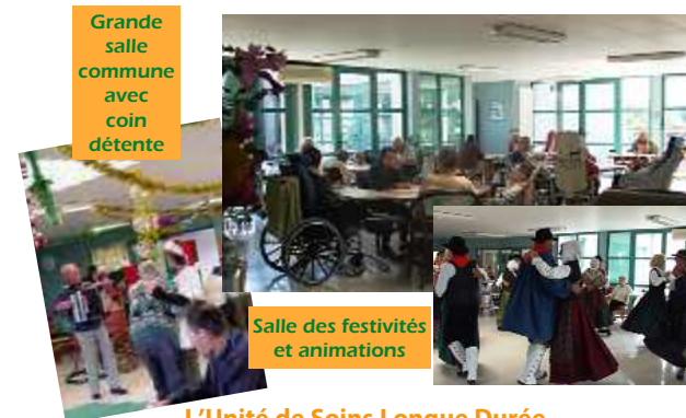
Grande salle commune avec coin détente